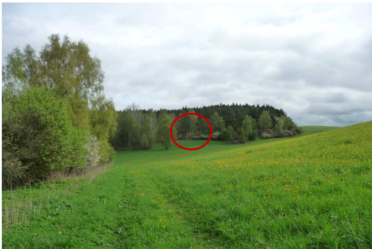
2 pohled na lom z hrany DoKP 1