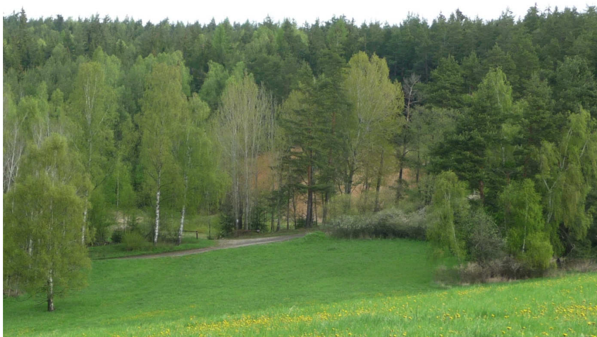
3 pohled na lom z DoKP 1